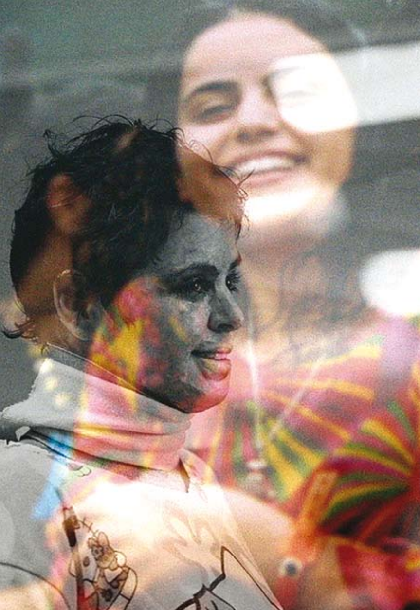
KINNERET VOOR EN NA DE ZELFMOORDAANSLAG.